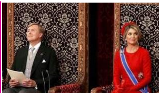
De feestelijke traditie van Prinsjesdag in Nederland is dit jaar omgeven door 'een rouwrand van verdriet'. Koning Willem-Alexander zei dat vandaag in de troonrede, die hij uitsprak in de Ridderzaal. De koning verwees daarmee naar de vliegcrash met MH17 op 17 juli, waarbij 298 inzittenden, onder wie 196 Nederlanders omkwamen. "In de zomer van 2014 bleek andermaal dat vrijheid en veiligheid kwetsbaar zijn, ook in ons deel van de wereld. De ramp boven het oosten van Oekraïne heeft velen direct geraakt, ook in de Verenigde Vergadering (de Eerste en Tweede Kamer). Het heeft allen diep geschokt", aldus Willem-Alexander. "De haat die elders mensen in het verderf stort, mag niet overslaan naar onze straten.", zei de vorst.